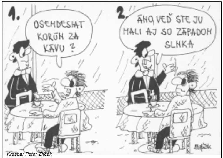
Kresba: Peter Zifčák